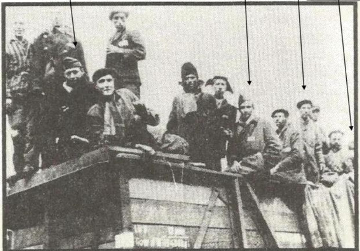
Terezin, 6 mei 1945. Aankomst van de Dodentrein.